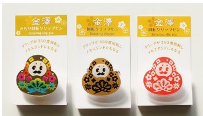
パッケージサイズ 約 W70×H90× 厚み 21mm