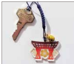
根付 ※鈴は付属しません