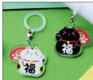
アンブレラマーカー