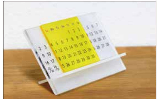
サイズ：幅 85 mm × 高さ 55 mm × 奥行 27 mm ※組み立て時

当店オリジナルデザインの卓上万年カレンダーを制作して頂く事でレーザー加工機、UVプリンターの基本的な使用方法をご理解頂けます。データ制作は不要です。文字の色、好きな文字盤カラーが選べます。