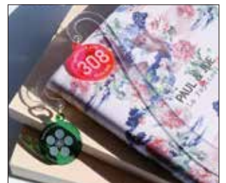
アクリル製ブックマーカー

※公共秩序、公序良俗に反するとみられる内容を含むもの、著作権の侵害に値する制作物等は一切お断りいたします。