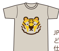
JPEG・PNG どちらも同じ仕上がり

淡色生地に白インク不使用はナチュラルな風合い。白インクを使用すると色が鮮やかハッキリします。