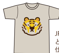
JPEG・PNG どちらも同じ 仕上がり

淡色生地に白インク不使用はナチュラルな風合い。白インクを使用すると色が鮮やかハッキリします。